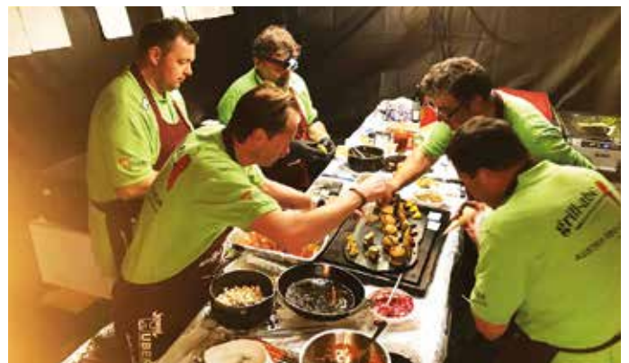
Alle höchst konzentriert bei der Arbeit – Fingerspitzengefühl und starke Nerven sind gefragt.

Vizeweltmeister unter mehr als 80 Teams von über 20 Nationen in der weltweiten Grillszene höchst erfolgreich vertreten. Hohes Können, intensive Vorbereitung und Training, super Teamarbeit und die große Unterstützung von Sponsoren führten zu diesem großartigen Erfolg.