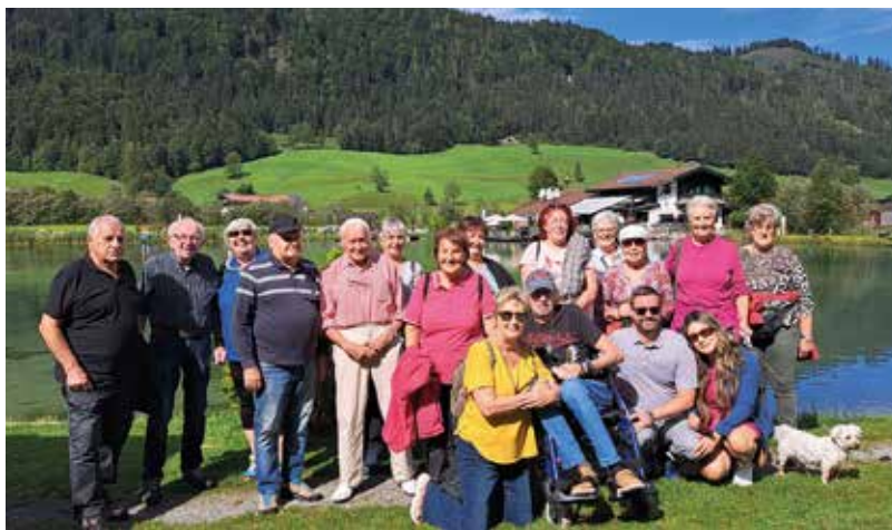
Beim Ausflug zum Quellfischteich stand die Kulinarik an oberster Stelle.

Das Ziel unseres Tagesausfluges im September war die Wildschönau. Mit dem vollbesetzten Reisebus ging es ins Mühlthal und von dort mit dem Bummelzug zur Schönanger Alm. In der Schaukäserei wurde uns das 1x1 der Käseherstellung erklärt, es durfte verkostet und natürlich gekauft werden. Nach dem Mittagessen und einem Verdauungsspaziergang ging es weiter zum Bergbauernmuseum und Handwerksmarkt in Oberau. Mit der Erkenntnis, dass die Arbeit heutzutage mit den maschinellen Helfern nicht mehr so anstrengend ist, traten wir mit vielen interessanten Eindrücken die Heimreise an.