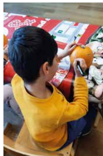
Ein gruseliger Kürbis entsteht.

Während dem Spielen an der frischen Luft fanden die Kinder eine große Auswahl an Naturmaterialien, welche sie im Anschluss ideal zum Basteln verwenden konnten. Natürlich durfte an Halloween auch das Kürbisschnitzen nicht fehlen und so entstanden viele wunderschöne Unikate, welche daheim aufgestellt wurden.