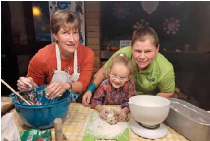
Unsere kleinste Teilnehmerin beim Apfelbrot-Backen