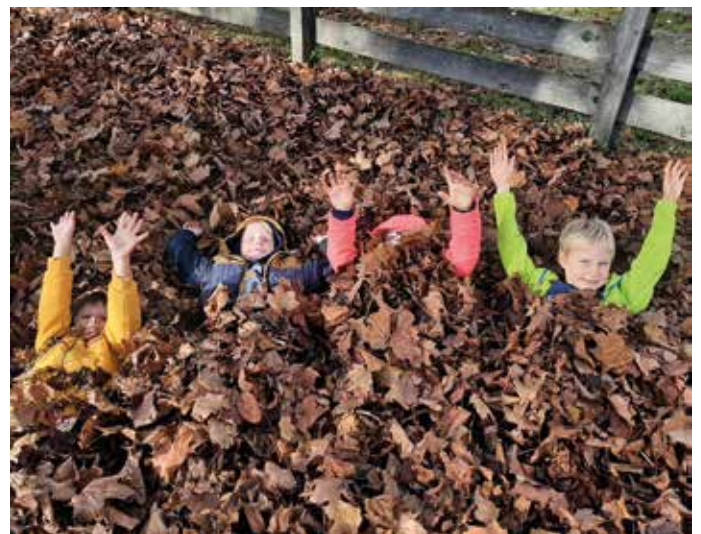
Einfach herrlich diese Blätter.

Jede Jahreszeit bietet sich für unterschiedliche Projekte und Spiele im Hort an. Gerade der Herbst brachte viel Abwechslung und Farbe in den Alltag. Kaum eine andere Zeit im Jahr ist so bunt und vielseitig.