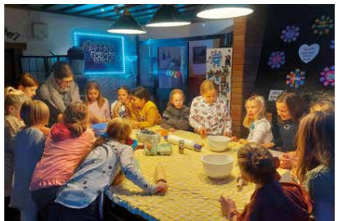
In der Weihnachts... äh, Jugendtreff-Bäckerei