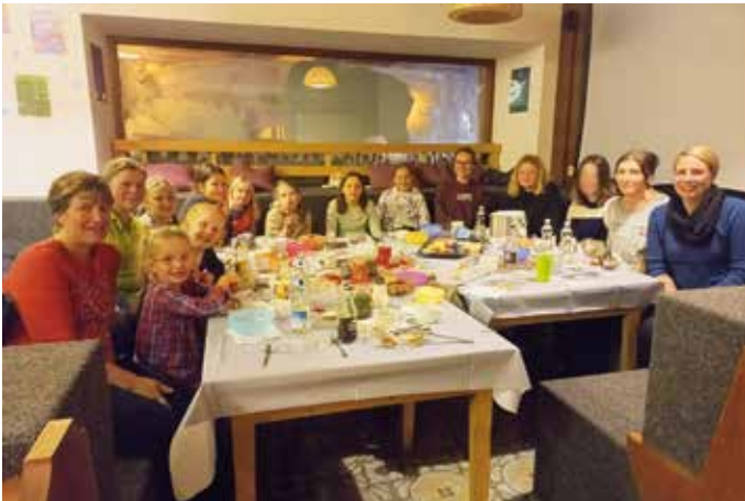
Bei der gemeinsamen Jause