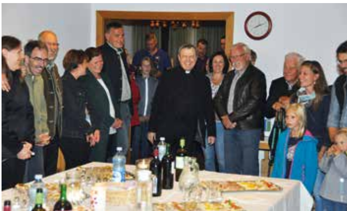
Lustig ging es zu bei der Agape im Pfarrhof.