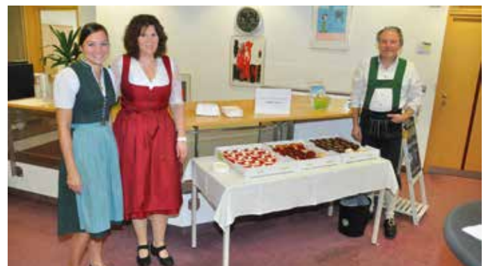
Die Kunden wurden am Weltspartag in der Raiffeisenbank Kirchdorf mit Kaffee und Kuchen verwöhnt.