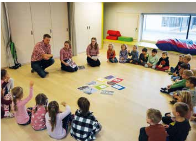
Gemeinsamer Ratscher mit der Landjugend Kirchdorf.

Text: Stefanie Hetzenauer, Bilder: KIGA Kirchdorf