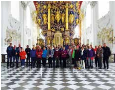
Bei der interessanten Exkursion in das Tiroler Oberland wurden das weltberühmte Stift Stams und der Olympiaort Seefeld (Bild Mitte: Vortrag im bekannten Seekirchl) erkundet.

wechslungsreichen Angebot neben der Bildung und Bewegung vor allem das Dorfleben fördern wollen.