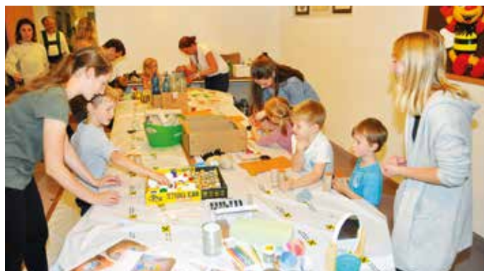
Eifrig wurden in der „Sumsi-Werkstatt“ farbige Bienen-Nistdosen gebastelt.

Über den Erfolg dieses nachhaltigen Umweltprojektes freute