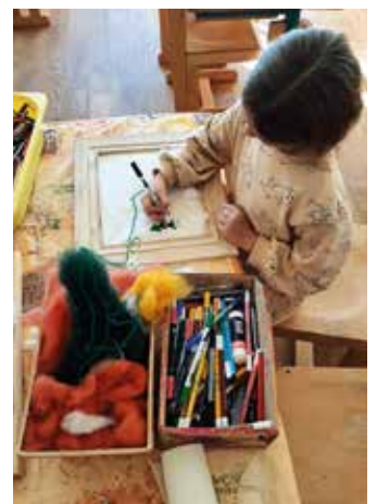
Die Vorbereitungen für Weihnachten laufen...

Mit dem Schneefall verabschiedete sich aber auch allmählich der Herbst, so dass es wieder hieß: „Auf die Plätze – fertig – los“, wenn Schneemann und Co mit großem Eifer in die Landschaft gezaubert werden.