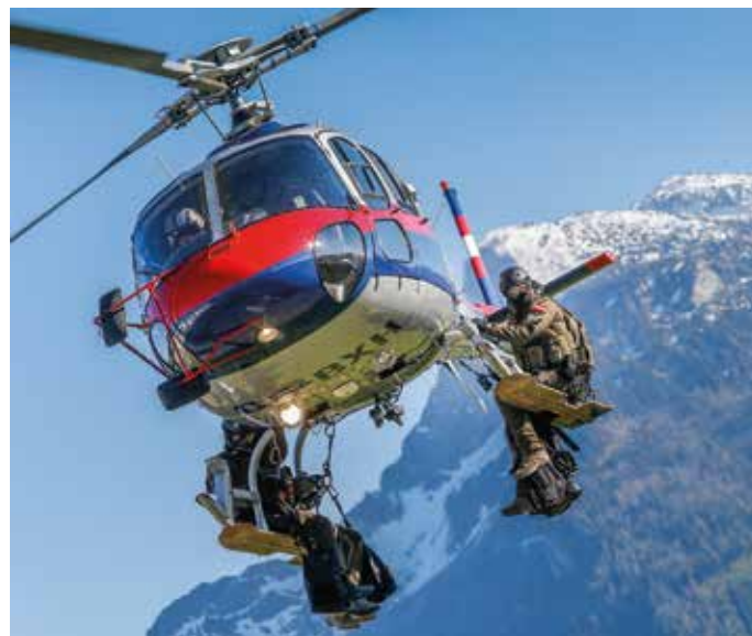
Flug mit EKO Cobra im Hintergrund der Untersberg

Gleich für einen seiner ersten Einsätze bei der Flugeinsatzstelle Salzburg wurde Clemens Tschinkel mit