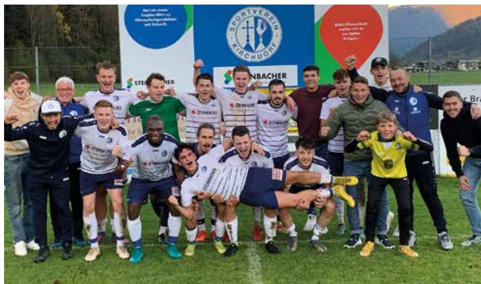
Die 1. Kampfmannschaft freut sich über den 3:2 Sieg gegen den SV Langkampfen.

Die U18 Mannschaft spielt in der Gruppe eins und steht nach zehn Spielen auf Rang acht in der Tabelle. Mit vier Siegen, einem Unentschieden und fünf Niederlagen erreichte man 13 Punkte. Ich bin sehr überrascht, dass unsere jungen Sportler so gut mit allen Mannschaften mithalten können.