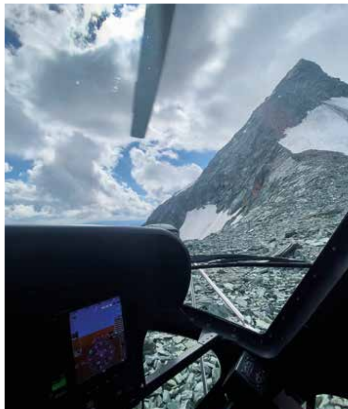
Zwischenlandung beim sog. „Bahnhof“ während eines Einsatzes am Großglockner mit Blick zum Gipfel

Was ist die Schwierigkeit bei Hochgebirgsflügen oder Taubergungen? Clemens: „Mit zunehmender Höhe nimmt die Luftdichte ab. Somit kann die Turbine in großen Höhen weniger Leistung erbringen als z.B. auf Meeresebene. Zudem kommt es im hochalpinen Gelände z.B. bei Föhnlagen, zu starken Winden und den damit verbundenen Luftverwirbelungen / Turbulenzen. Mit der Zeit kann man den ‚Wind lesen‘ und dann den besten Flugweg herausfinden. Bei Taufügen hängt der Flugretter, der mit dem Piloten per Funk kommuniziert, bis zu 100m unter dem Hubschrauber. Eine entsprechende, intensive Ausbildung und laufende Weiterbildungen sind für solche Einsätze Voraussetzung. Die Erfüllung eines Einsatzes ist nur mit Teamwork möglich. Der Pilot vertraut dem Flugretter zu 100 % und umgekehrt. Durch klare Absprachen / Briefings im Anflug sowie das Abarbeiten der trainierten Verfahren gelingen auch schwierige Einsätze sicher.“