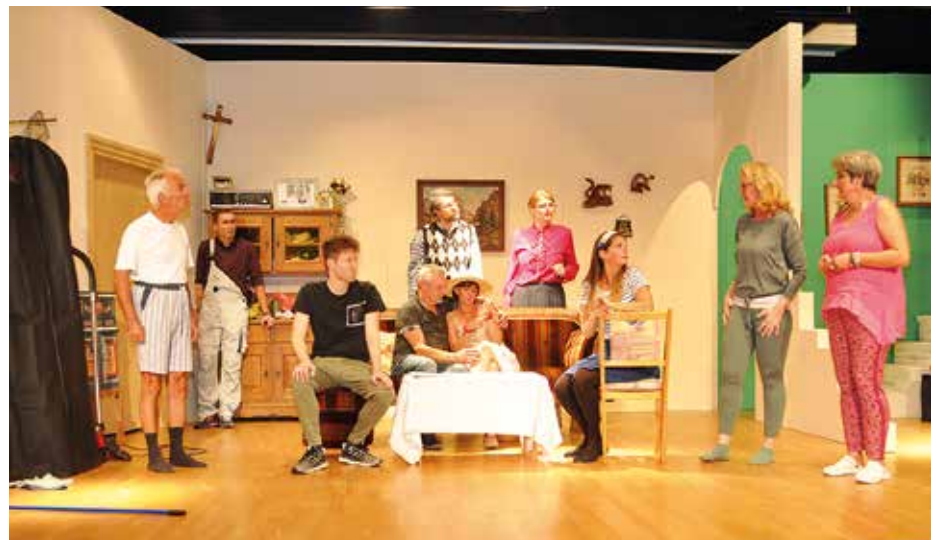
Was Georg schon lange weiß, gibt erst die letzte Szene Preis.

Nun wird schon wieder nach einem nächsten Theaterstück gesucht und wir freuen uns, wenn es im Frühling wieder heißt: „Vorhang auf“. Weitere Fotos von den Theateraufführungen sind auf der Homepage: www.heimatbuehne-kirchdorf.at zu finden.