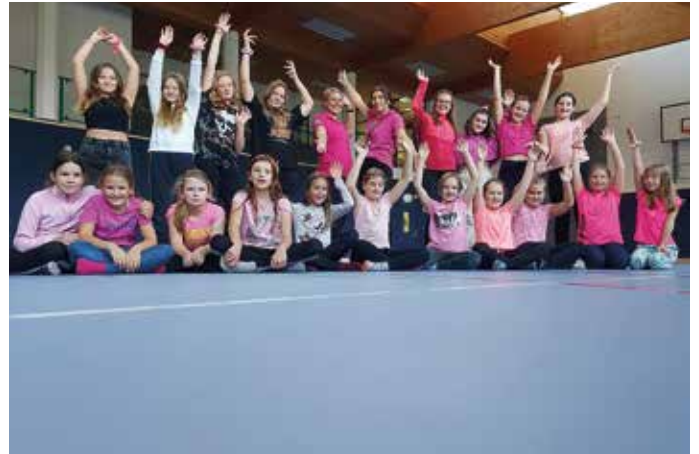
Wir feierten den Welt-Mädchentag