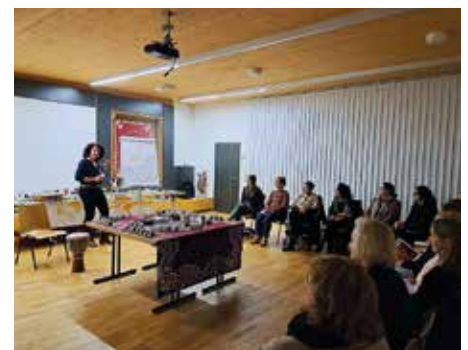
Ein mystischer, duftender Räucherabend fand im Feuerwehrhaus Erpfendorf statt.

Nach einer kurzen Weihnachtspause startet das neue Winter/Frühlingsprogramm ab 9. Jänner 2023. Aktuelle Informationen und detaillierte Beschreibungen zu allen Veranstaltungen gibt es auf unserer Homepage www.erwachsenenschulen.at/kirchdorf , Auskünfte und Anmeldungen unter 0664 / 175 09 84 .