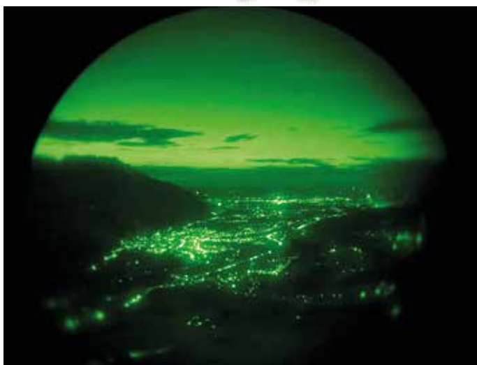
Blick durch eine NVG-Restlichtverstärkerbrille (Night Vision Goggles)

Beim schrecklichen Terroranschlag in Wien 2020 war Clemens Tschinkel die ganze Nacht mit seinem Helikopter im Einsatz und musste die Lage aus der Luft sondieren.