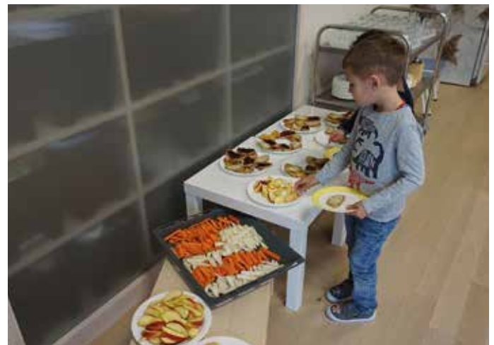
So lecker sah unsere Jause aus!