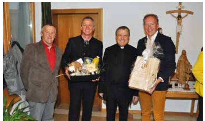
Der Pfarrgemeinderat und Gemeinderat gratulierten herzlich.